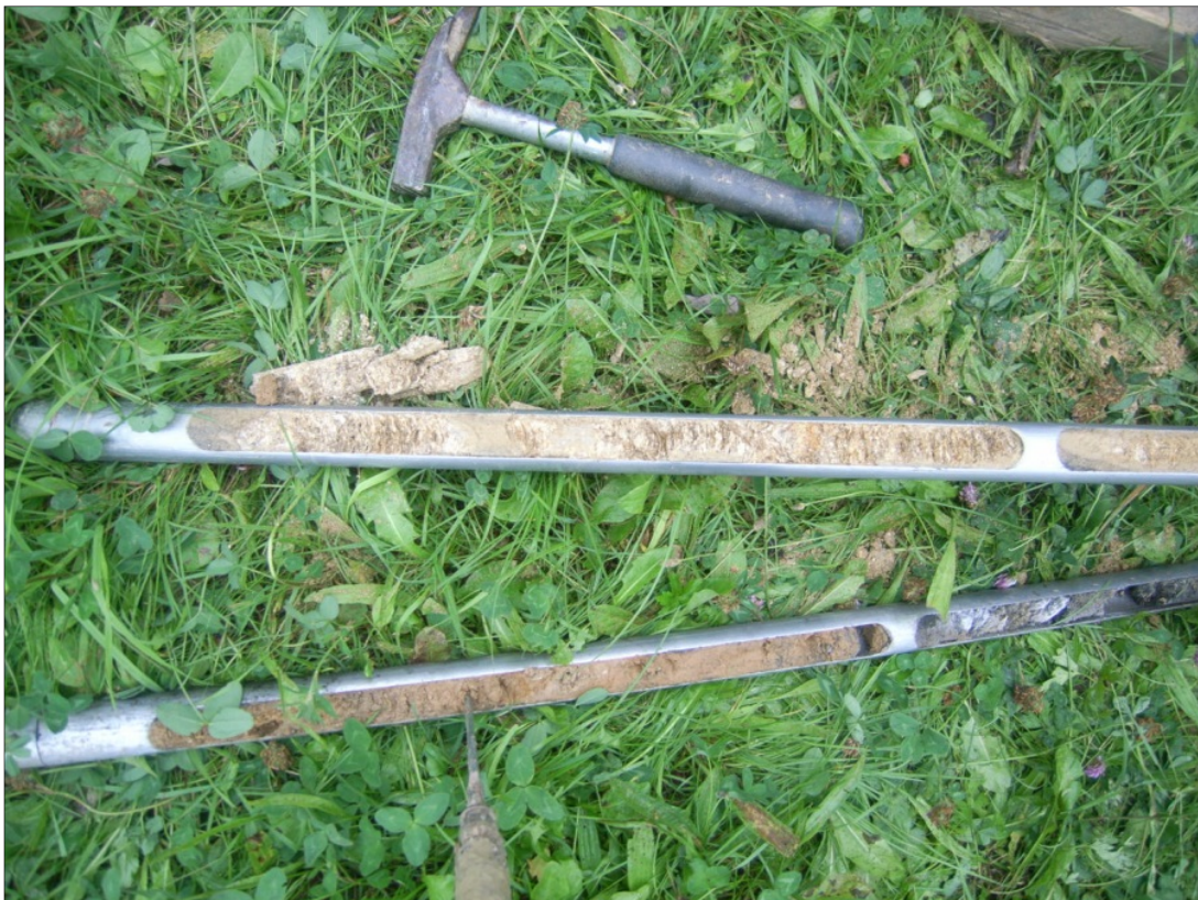
Bild 2: mit Rammkernsondierung erbohrtes Kernmaterial zur Dokumentation des Schichtenprofils