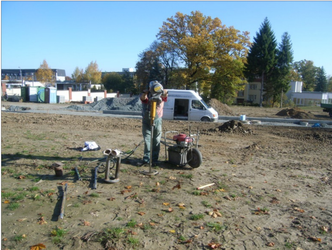
Bild 1: Abteufen einer Rammkernsondierung als zusätzlicher Aufschluss