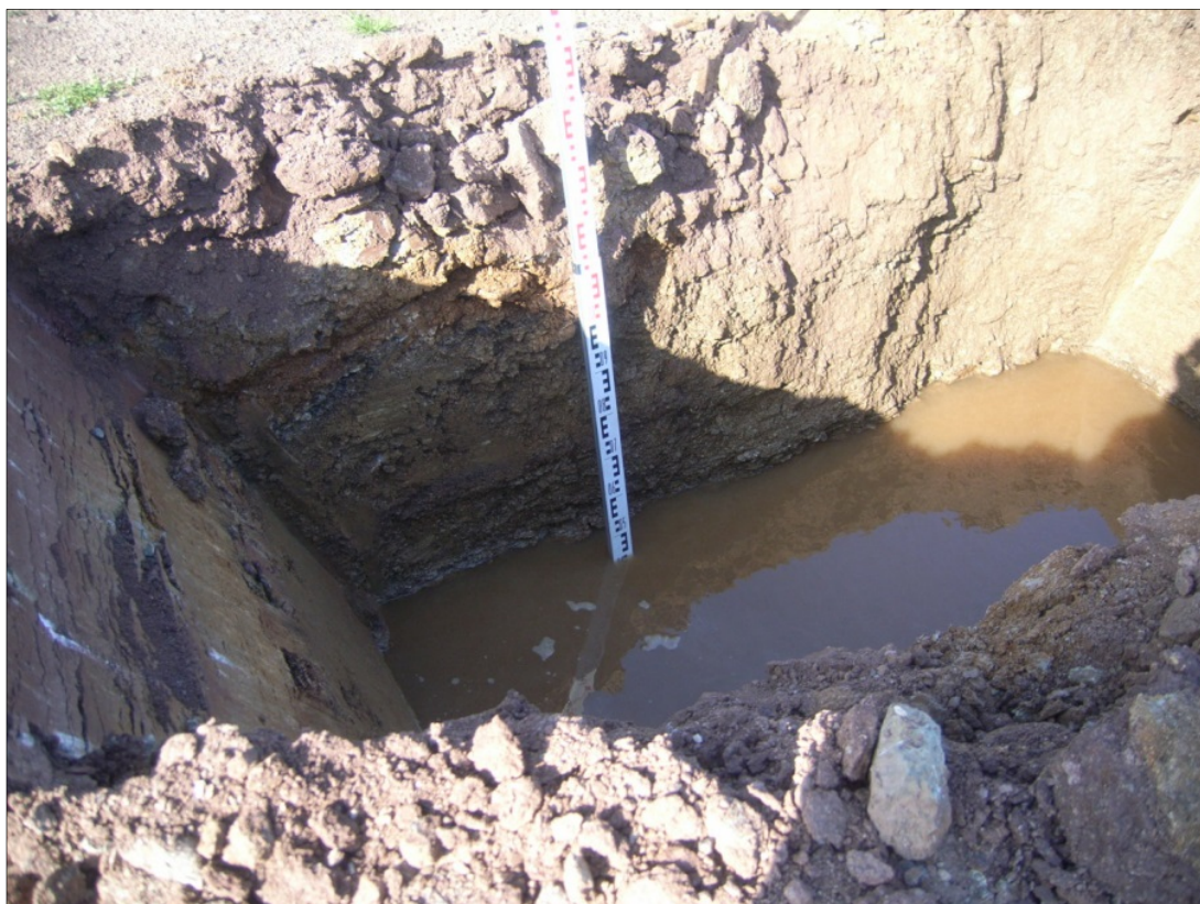
Bild 4: Durchführung Sickerversuch, Messung der Wasserstandsabsenkung